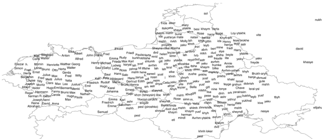
Abbildung 1: Vornamen im Language and Culture Archive of Ashkenazic Jewry

Der Umstand, dass zum Zeitpunkt der Namenwahl das Westjiddische bereits weitestgehend zu Gunsten des Deutschen aufgegeben war, während das Ostjiddische im vorwiegend slavischen Gebiet bis ins 20. Jahrhundert vital blieb, liefert einen areallinguistischen Faktor, den es zu prüfen gilt. Während ein solcher Einfluss bezüglich der Familiennamen nicht auf den ersten Blick offensichtlich erscheint, ist er bei den Vornamen, die um 1900 vergeben wurden (Abbildung 1), augenfällig: deutsche Vornamen sind zu diesem Zeitpunkt im deutschen Sprachgebiet die Regel, während hebräischstämmige (und vereinzelt slavische) Namen im ostjiddischen Raum verwendet werden.