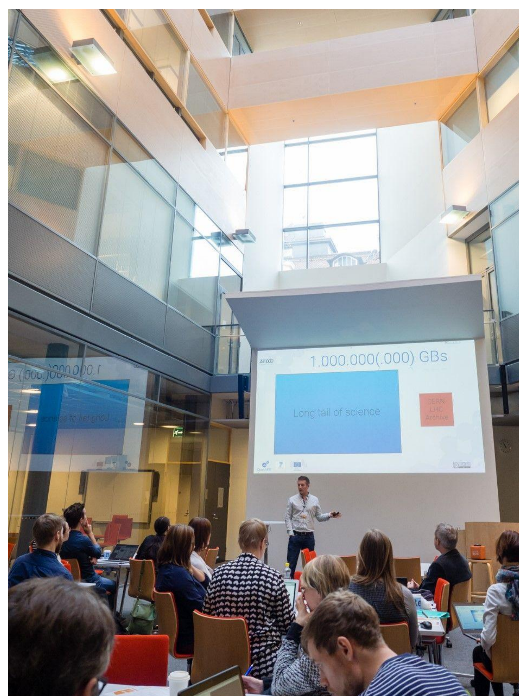
HY:n kirjaston järjestämä Open Science Workshop 20.10.2015