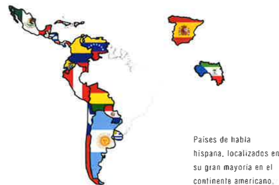
Países de habla hispana, localizados en su gran mayoría en el continente americano.

El discurso expuesto en los medios de difusión no resultaba alentador en ningún sentido. Asimismo, nos propusimos que dicho quehacer permitiera que estudiantes de diferentes niveles, facultades e intereses llevaran a cabo actividades, según el tipo de curso al que estaban asistiendo y acorde a sus capacidades. No hay que olvidar que las habilidades propias del mundo laboral se han convertido en un punto de mira del contexto académico. ¿Pudiera el manejo de la lengua de más de 400 millones de habitantes resultar en un rayo de luz para el presente y futuro de nuestros estudiantes, así como para el porvenir de nuestros cursos?