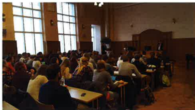
Imagen del aula magna del Centro de Lenguas de la Universidad de Helsinki

En 2014 los profesores del Departamento de Español del Centro de Lenguas de la Universidad de Helsinki decidimos crear una actividad que incentivara a los estudiantes para que se mantuviesen inmersos en la lengua hispánica, al tiempo que adquirieran información sobre la situación actual del mundo laboral de los países hispanohablantes; y les permitiera ampliar su perspectiva laboral, teniendo en consideración que la coyuntura de los graduados universitarios finlandeses se encontraba en un momento escabroso.