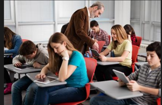
Dlearn.Helsinki - @DlearnHelsinki